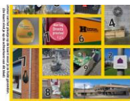
Maak onderweg een foto van het gevonden ei

Iedereen mag meedoen aan deze scavenger hunt.